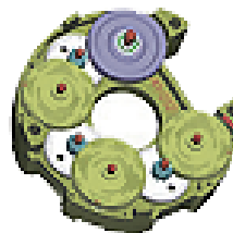
マルチターン ギアボックス

多回転を検出するシステムを複数のギアの組合せで機械的に値を保持する独自技術でバッテリーレス化を実現しました。そのため、長時間通電なしでもデータが喪失することはありません。