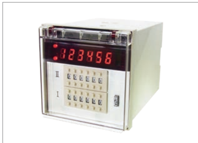
定格仕様 (種類ごと)